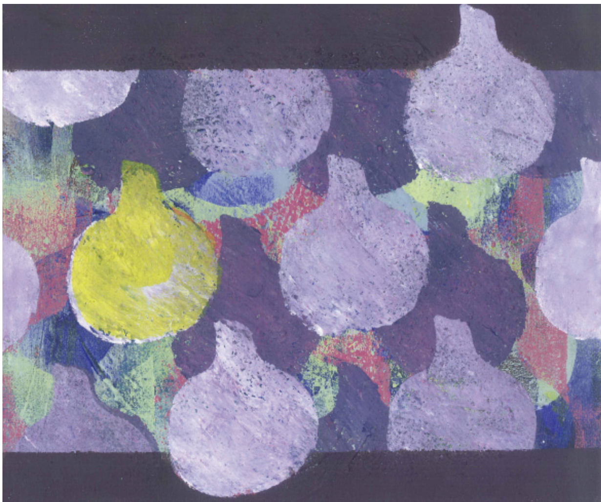
billeder af Birgit Pathuel