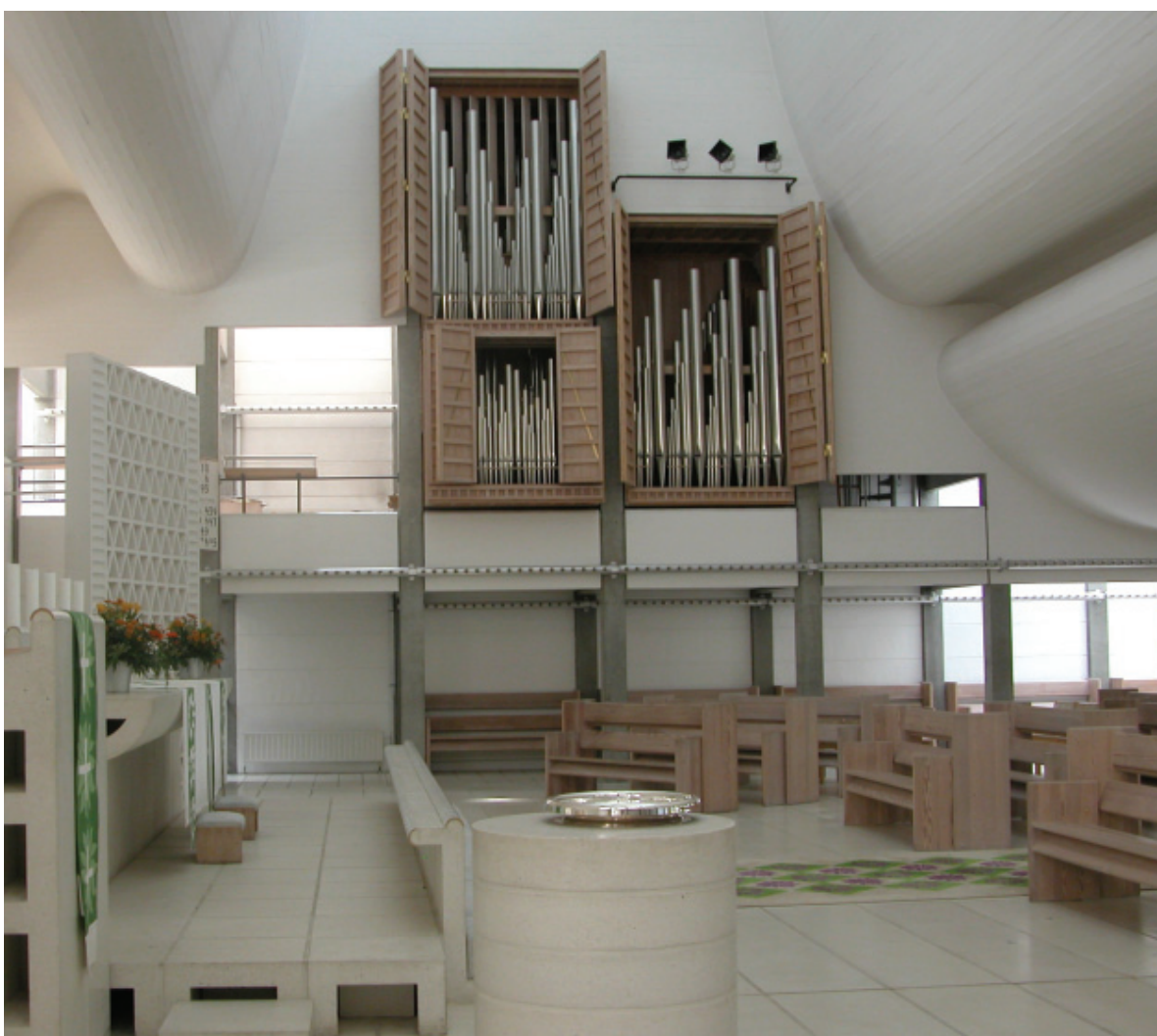
Bagsværd kirke, interiør