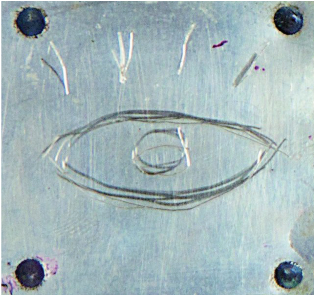
ikon af Birgit Pathuel

1. Med sommerunderfulde fløjt i Paradisets haver er glæden dyb og livet højt og jorden fyldt af gaver og luften fyldt af Helligånd og havet spejler himlen med lys fra stjernevrmlen